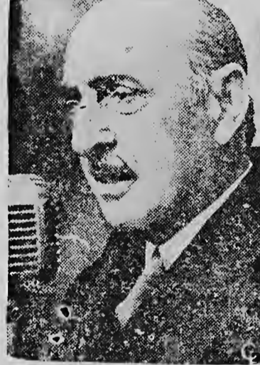
MAARSCHALK PAPAGOS, die in Griekenland een overweldigende stembusoverwinning verwierf, kondigde dezer dagen zeer belangrijke hervormingen aan. MARISCAL PAPAGOS, kende a haya un tremende victoria electoral na Grecia, a anuncia su reformatiennan importante uno di dianañ aki.